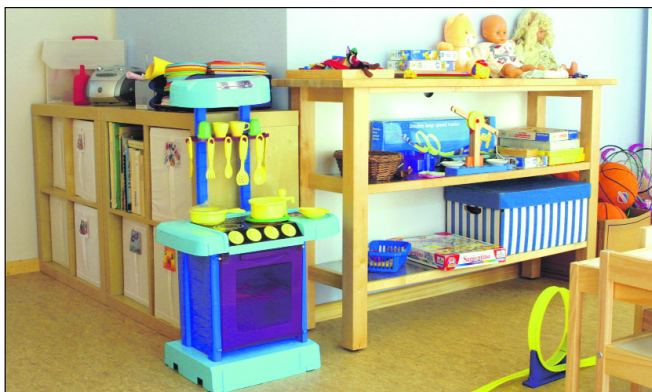
Az egész intézményt a gyermekközpontúság határozza meg